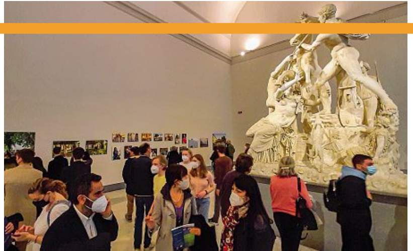
Vernissage I quadri su Don Chisciotte a Palazzo Reale e l'inaugurazione della mostra di Fiorito al Mann

tende ricostruire la storia della serie di arazzi con Storie di Don Chisciotte, eseguiti dalla manifattura napoletana nella seconda metà del '700, ispirate all'opera di Miguel de Cervantes. La mostra, che chiuderà il 6 settembre, curata da Mario Epifani, direttore di Palazzo Reale, e da Encarnación Sánchez García, membro corrispondente della Real Academia Española, seguirà il filo del romanzo attraverso la serie completa dei cartoni, messi a confronto con alcuni degli arazzi oggi conservati al Quirinale, con le più preziose edizioni illustrate presenti nella Biblioteca Nazionale di Napoli e con lo spartito dell'opera Don Chisciotte della Mancia del compositore Giovanni Paisiello, proveniente dal Conservatorio di San Pietro a Majel-